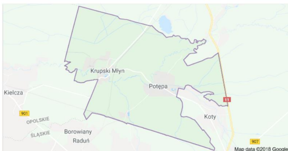
Rysunek 1. Mapa Gminy Krupski Młyn

Szczegółowa lokalizacja i inne dane dla danej lokalizacji zostały przedstawione w załączniku do PFU.