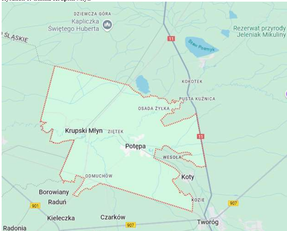
Rysunek 1. Gmina Krupski Młyn

Wysoki stopień lesistości sprawia, iż grunty rolne, zajmując zaledwie 7,5% ogólnej powierzchni gminy, stanowią jedynie formę uzupełniającą dodatkowo sukcesywnie uszczuplaną z uwagi na presję urbanizacyjną. Przyczyną małej ilości pól uprawnych są również gleby o niskiej jakości i słabej klasie bonitacyjnej. Przeważający udział użytków zielonych oraz brak pól uprawnych sprawia, że głównym obszarem ich koncentracji są doliny rzeczne przecinające obszar gminy, w szczególności w jej wschodniej części.