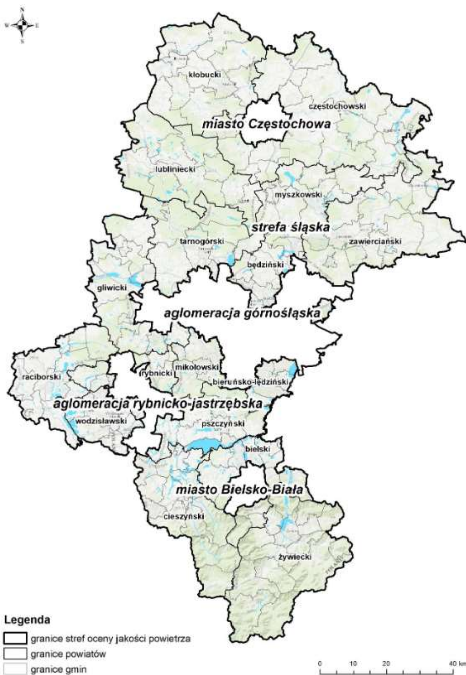
Rysunek 3. Podział województwa śląskiego na strefy