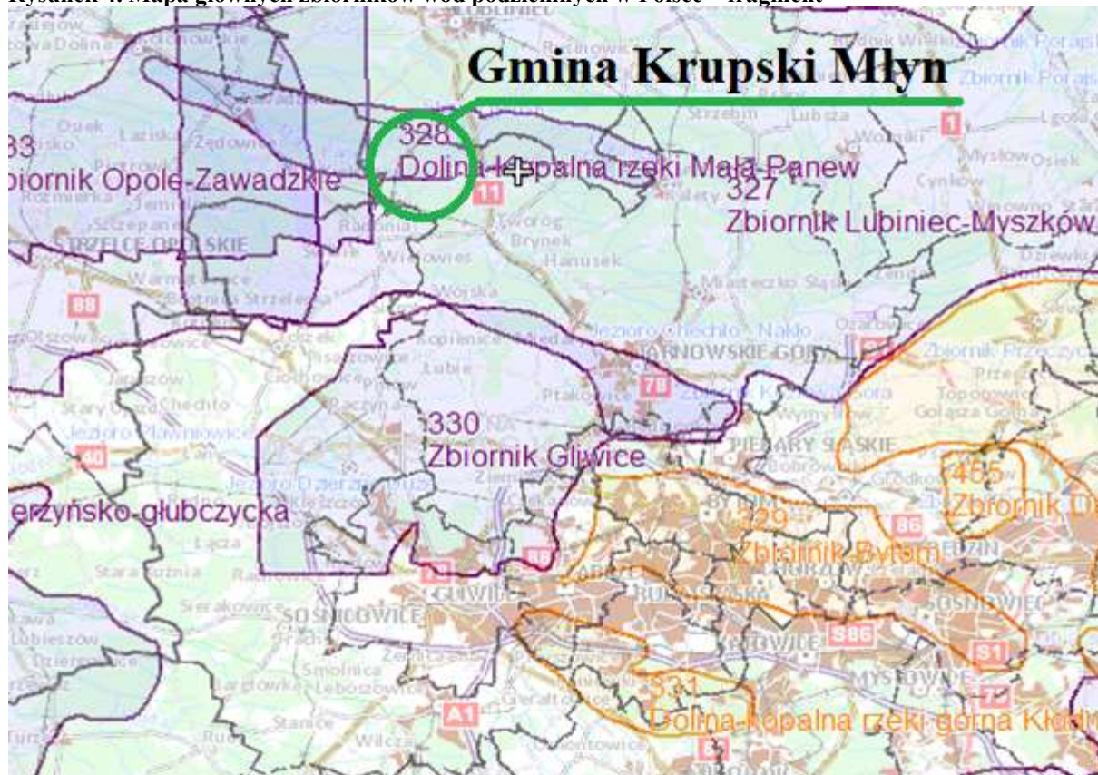
Rysunek 4. Mapa głównych zbiorników wód podziemnych w Polsce – fragment

\mu\text{S/cm} . Woda jest średnio twarda (twardość ogólna 156-224 \text{mgCaCO}_3/\text{l} ), charakteryzującą się niską zawartością związków azotu (azotanów, azotynów i jonu amonowego) oraz zawartościami żelaza na poziomie do 580 \mu\text{g Fe/l} , manganu do 23 \mu\text{g Mn/l} . Według analiz z lat 2009 – 2022 r., zawartości badanych wskaźników występowały na zbliżonym poziomie. Badana woda nie wykazuje oznak zanieczyszczenia bakteriologicznego. Pod względem fizykochemicznym i bakteriologicznym woda pobierana analizowanym ujęciem, generalnie odpowiada wymogom stawianym w Rozporządzeniu Ministra Zdrowia z dnia 7 grudnia 2017 r. w sprawie jakości wody przeznaczonej do spożycia przez ludzi (Dz. U. 2017, poz. 2294). Przekroczone są zawartości żelaza. Przed podaniem do sieci woda jest uzdatniana. Obserwowany na wodach z ujęcia podwyższona zawartości żelaza w jest zjawiskiem dość powszechnym w studniach ujmujących poziom wodonośny serii węglanowej triasu. Jest to zanieczyszczenie typu geogenicznego. Stan mikrobiologiczny wody jest dobry, wszystkie wskaźniki odpowiadają normie. Biorąc pod uwagę klasyfikację jakościową wód wg Rozporządzenia Ministra Gospodarki Morskiej i Żeglugi Śródlądowej z dnia 11 października 2019 roku w sprawie kryteriów i sposobu oceny stanu jednolitych części wód podziemnych (Dz.U.2019, poz. 2148) stwierdzono, iż badane wody, w zakresie oznaczanych wskaźników, można zaliczyć głównie do klasy I (wody bardzo dobrej jakości).