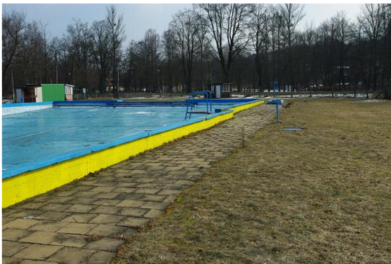
Stary chodnik – do rozbiórki