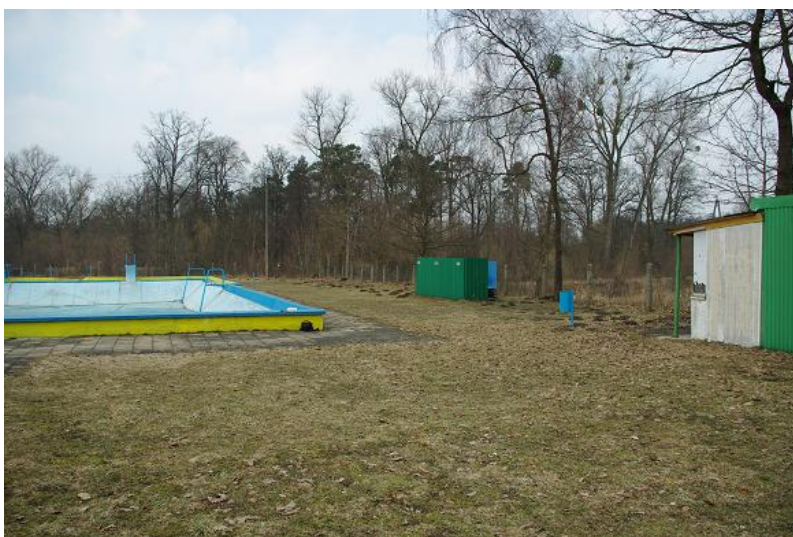
Stary chodnik – do rozbiórki – teren pod budowę nowego chodnika.